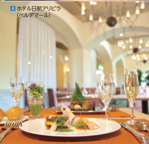
4 ホテル日航アリビラ (バルデマール)