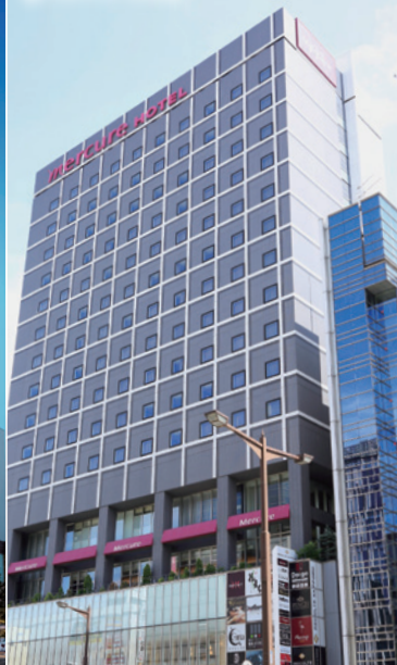
3 メルキュール札幌