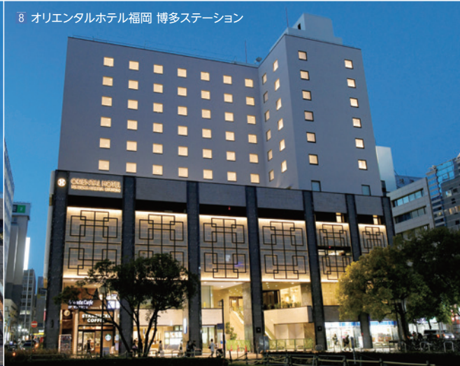
8 オリエンタルホテル福岡 博多ステーション