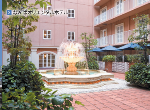
3 なんばオリエンタルホテル