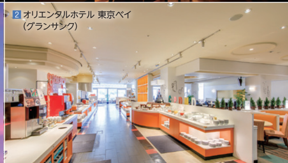
2 オリエンタルホテル 東京ベイ (グランサンク)