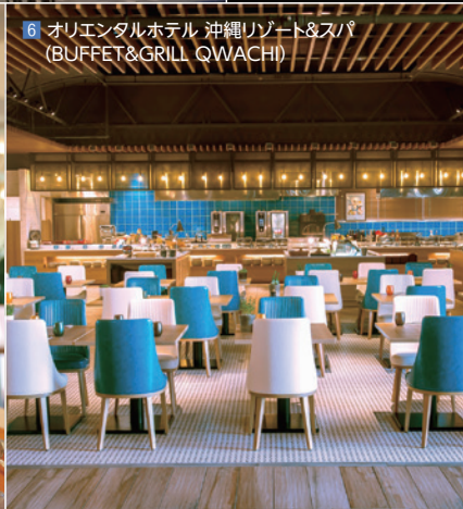
6 オリエンタルホテル 沖縄リゾート&スパ (BUFFET&GRILL QWACHI)