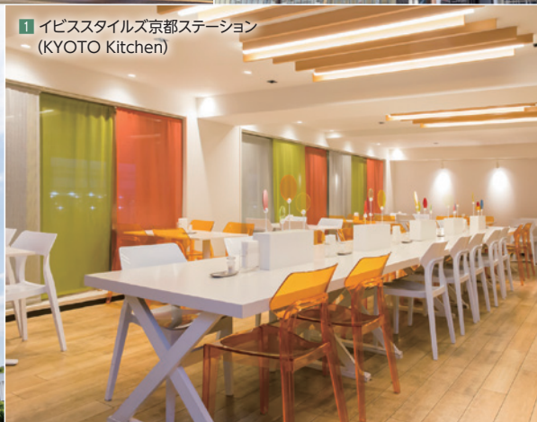
1 イビスタイルズ京都ステーション (KYOTO Kitchen)