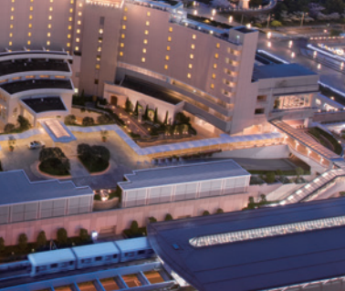
15 オリエンタルホテル ユニバーサル・シティ