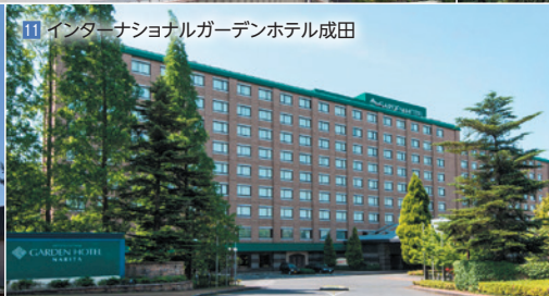
11 インターナショナルガーデンホテル成田