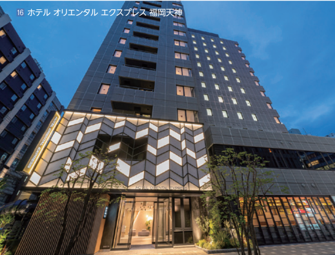
16 ホテル オリエンタル エクスプレス 福岡天神