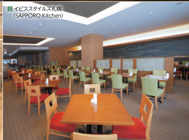
2 イビスタイルズ札幌 (SAPPORO Kitchen)