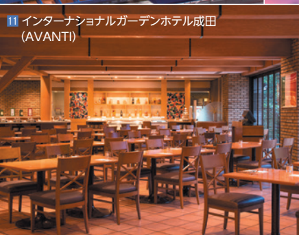
11 インターナショナルガーデンホテル成田 (AVANTI)