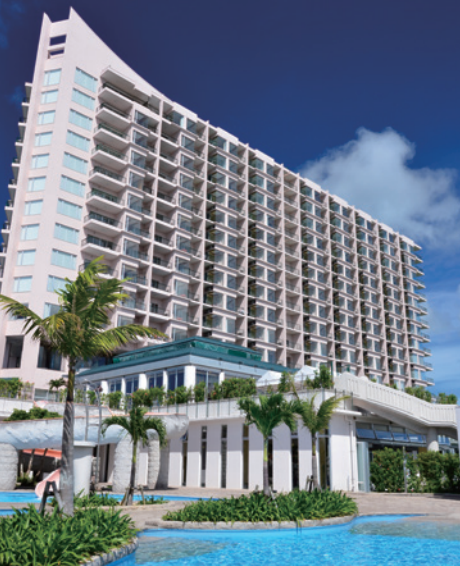
7 シェラトングランドホテル広島