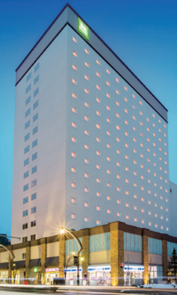
2 イビスタイルズ札幌