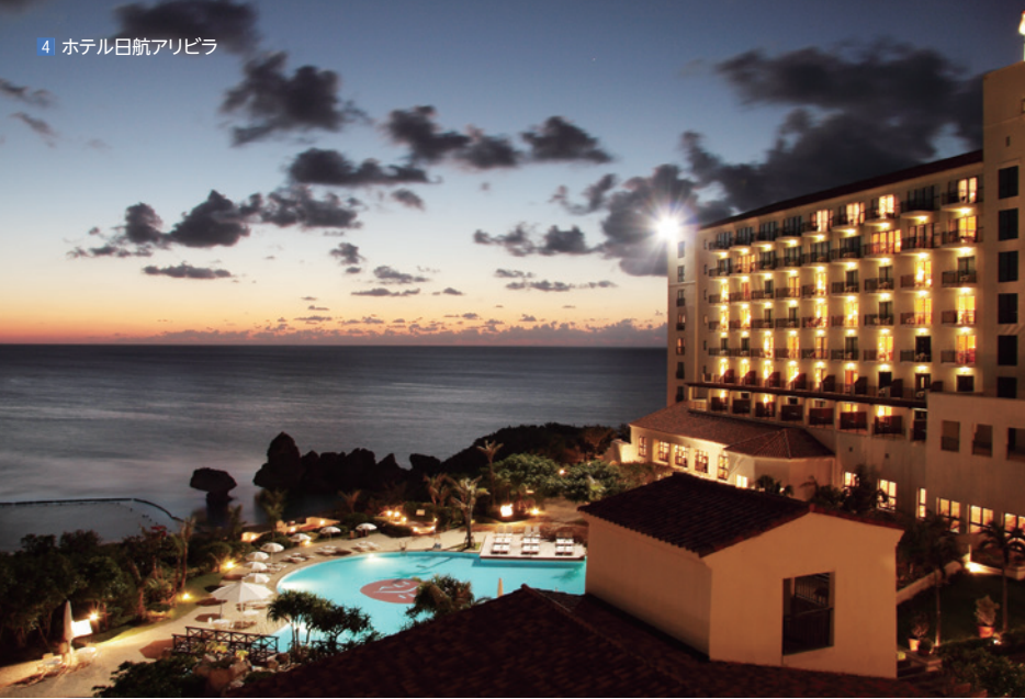
4 ホテル日航アリビラ