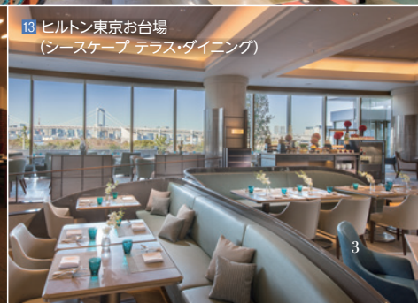
13 ヒルトン東京お台場 (シースケープ テラス・ダイニング)