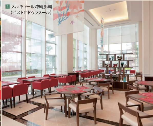
4 メルキュール沖縄那覇 (ビストロドゥラメール)