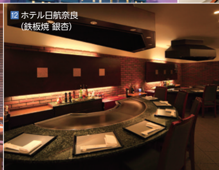
12 ホテル日航奈良 (鉄板焼 銀杏)