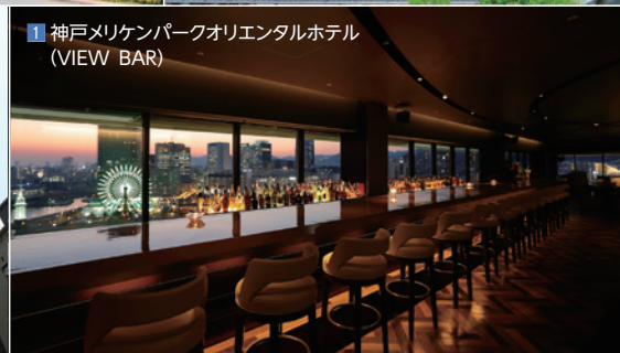
1 神戸メリケンパークオリエンタルホテル (VIEW BAR)